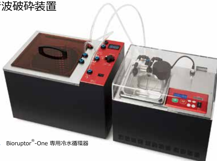
▲ Bioruptor ® -One 専用冷水循環器